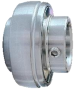
BALERO ACERO INOXIDABLE SSUC2